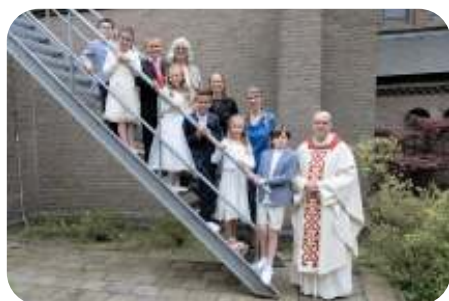
HH. Petrus en Paulus