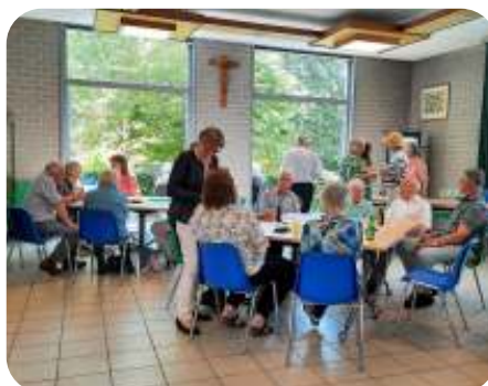
Beheerteam en altaarteam

Zondag 4 juni was er een gezellige middag voor de vrijwilligers van de Trinitasparochie. Het beheerteam en het altaarteam bedankten de vrijwilligers hiermee voor hun inzet in de parochie. De middag begon met een kopje koffie of thee met iets lekkers natuurlijk. Door het prachtige weer werd er dankbaar gebruik gemaakt van het terras. Ter vermaak werd twee keer het spel 'petje-op-petje-af' gespeeld. En er werden ook wat moppen van pastor Olsthoorn verteld. U begrijpt dat er flink werd gelachen. Heerlijke hapjes samen met een glaasje fris, wijn of bier verhoogden de sfeer. Wij kijken terug op een geslaagde middag.