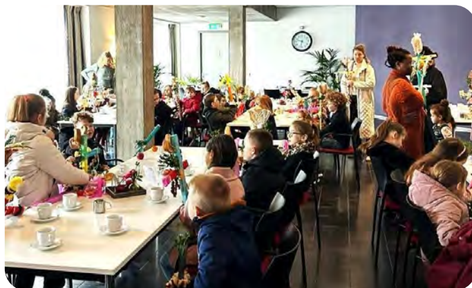
Herinnering aan de mooie voorbereiding van Palmpasen door kinderen in de Benedictus en Bernadettekerk